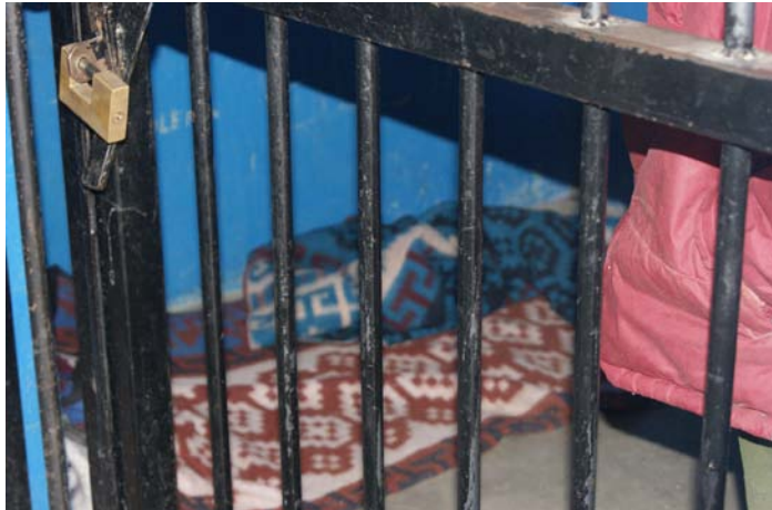
Un total de 90 visitas a cerosos.

En el tema penitenciario, la Comisión Estatal de Derechos Humanos realizó un total de 90 visitas de supervisión y atención a internos a los centros de reeducación social en el Estado. De este monitoreo casi permanente se desprendió la atención de 251 internos, a quienes se les brindó asistencia, orientación y respaldo en sus gestiones ante autoridades penitenciarias, a fin