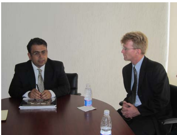
Reunión con el Vicecónsul de Estados Unidos.

El Vicecónsul de Estados Unidos en México con sede en Guadalajara, Greg Simkiss, expresó su preocupación por el incremento de bandas de los llamados “polleros” y de estafadores, que solo engañan a quienes quieren ingresar a Estados Unidos de forma ilegal. Hemos detectado delincuentes que engañan a las personas, les quitan hasta su