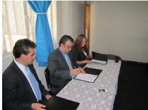
Fueron 9 convenios signados por la CEDH.

En materia de convenios de colaboración interinstitucional, en el periodo en que se informa, fueron firmados un total de 9 convenios de trabajo con diversas instituciones tanto públicas como de organizaciones de la sociedad civil, con el claro objetivo de sumar esfuerzos y recursos a favor de sectores y demandas muy concretas de la sociedad, todas ellas relacionadas con el tema de la promoción y protección de los derechos humanos.