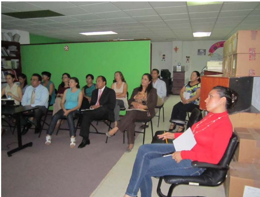
La capacitación al personal es una constante para poder dar una atención más eficiente y humana a la población.

La capacitación ha sido una herramienta eficaz para mantener actualizado al personal en los temas de gran trascendencia e importancia para la Comisión.