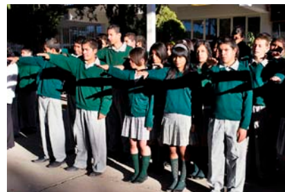
Un total de 62 quejas por Bullying.

En lo referente a las quejas recibidas por esta comisión, cabe destacar que y las entidades gubernamentales que más quejas propiciaron de parte de la ciudadanía fue la mala actuación de los cuerpos de seguridad pública municipal y estatal, ya que de las 373 quejas recibidas en total, 261 se produjeron luego de una inadecuada actuación de esas entidades públicas de seguridad, bajo la presunción de haber violado derechos a la integridad física, seguridad personal y violación al derecho a la libertad, hechos condenables en términos de una sociedad democrática y en momentos en los que los esfuerzos por profesionalizar a los elementos policíacos han sido progresivamente elevados.