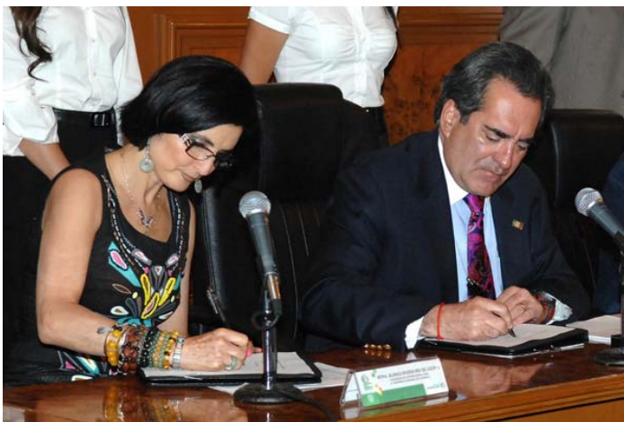
El Mandatario y su esposa sensibles al problema del Bullying.

Otro apunte importante es el relacionado con la asistencia psicológica por parte de la CEDH en aquellos casos en los que las víctimas presentaron daños a raíz de la violencia escolar. Esta herramienta ha sido de trascendental importancia porque ha permitido devolver la seguridad en sí mismos de los jóvenes agredidos.