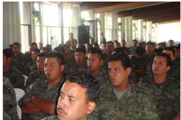
Militares en capacitación

En este renglón cabe destacar la participación de mandos medios y altos de las Fuerzas Armadas adscritas a la 14 va. zona militar teniendo una participación de 600 elementos a quienes se les impartió talleres como Equidad de Género y Detenciones Arbitrarias, contenidos que les han sido de gran utilidad.