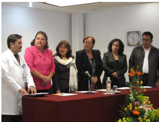
Una muerte digna también es un derecho humano.

Los días 9,10 y 11 de este mes se efectuó con éxito un ciclo de conferencias sobre cuidados paliativos. “Una muerte digna es también un derecho humano fundamental” afirmó el Ombudsman Omar Williams López Ovalle, tras sostener que aquellos pacientes diagnosticados con alguna enfermedad crónico-degenerativa y cuyo avanzado estado de salud los ponga en la antesala de la