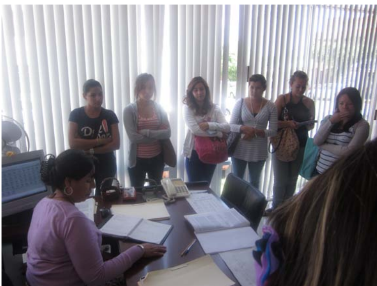
Fueron 49 las propuestas de conciliación.

A la Visitaduría le corresponde conocer, analizar e investigar las quejas e inconformidades sobre presuntas violaciones a derechos Humanos cometidas por autoridades de carácter estatal o municipal, realizar las actividades necesarias para lograr por medio de la conciliación, la solución inmediata entre las partes, salvo en los casos de violaciones graves a Derechos Humanos.