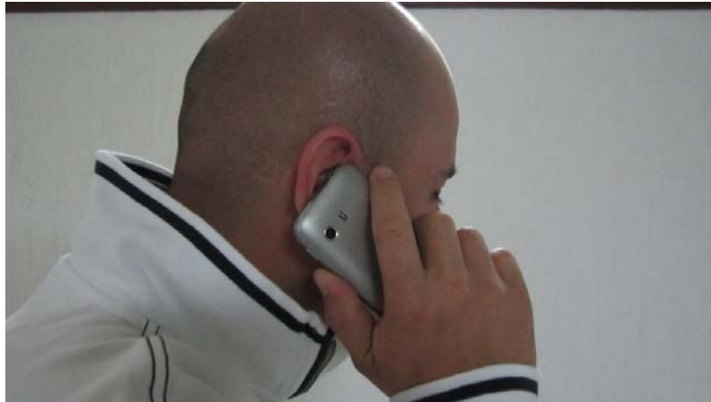
Por teléfono la CEDH recibió 417 llamadas para atención a la ciudadanía.

Es necesario poner al alcance de los ciudadanos los servicios de la Comisión para que ésta cumpla su función para la que fue creada. Para ello fueron dispuestos mecanismos de comunicación como la línea telefónica 01 800, una línea telefónica gratuita; también el teléfono del migrante, mecanismo de comunicación de carácter gratuito que sólo funciona si se marca de una línea en Estados Unidos y se fortaleció el empleo del Internet y del teléfono de emergencias que opera las 24 horas los 365 días.