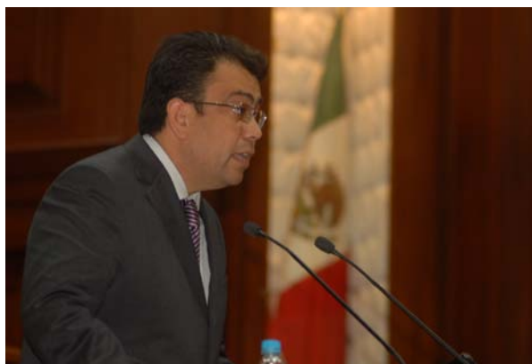
Acudió a la glosa de su informe de labores

Invitado por los diputados de la LXI Legislatura, el Ombudsman acudió a la sede del Congreso y ante el pleno expuso detalles sobre su informe de actividades correspondientes al año 2011. Ahí, Omar Williams López Ovalle hizo una exposición en donde abordó los temas sustanciales del documento que había sido entregado con anterioridad, y respondió las preguntas formuladas por los representantes populares sobre temas relativos al quehacer de la propia comisión.