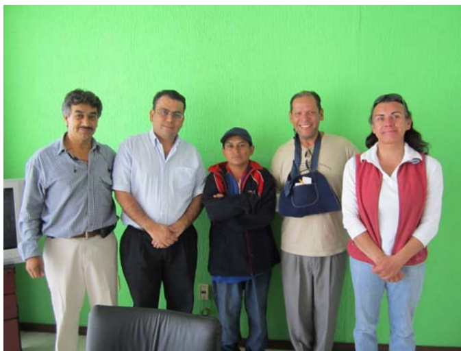
Sociedad civil organizada y CEDH a favor de los necesitados.

Un migrante de origen guatemalteco relató, en su travesía de 30 días por México un atraco y dos secuestros de migrantes a cargo de bandas de criminales, además del abandono sufrido por el pollero que lo guiaba a Estados Unidos. En Aguascalientes ONG`s y CEDH unieron esfuerzos para dar apoyo a este migrante quien finalmente se quedó en el desamparo y acudió a la Comisión para recibir orientación y apoyo, mismos que le fueron brindados.