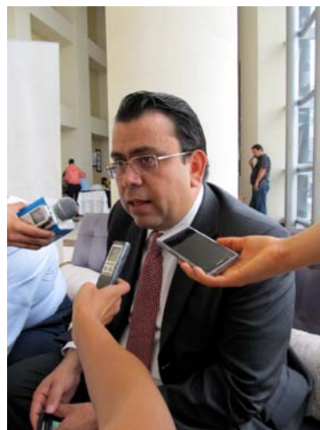
Pide a alcaldes mejorar sus cárceles.