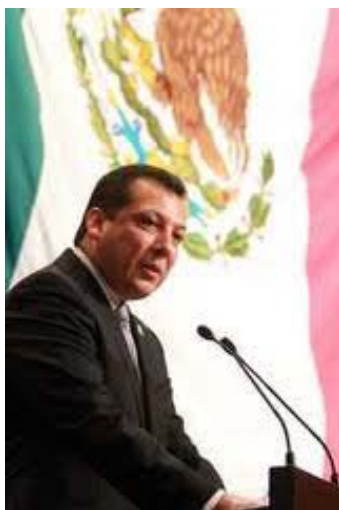
Dr. Raúl Plascencia Villanueva Ombudsman Nacional.

Durante el 2011, la CEDH emitió 18 recomendaciones y recibió 348 quejas, siendo Seguridad Pública y Justicia las entidades públicas con mayor número de recomendaciones y quejas. Le sigue el sector educativo en el que alertó el incremento de la violencia escolar, conocida como Bullying. Hizo un reconocimiento a la voluntad política del Gobernador Carlos Lozano de la Torre como un hombre convencido y respetuoso de los derechos humanos en Aguascalientes.