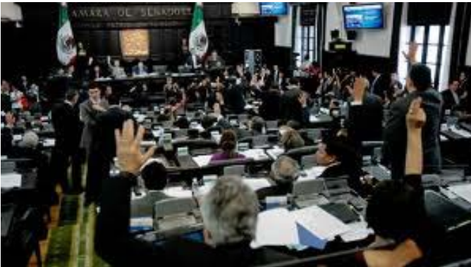
El Senado aprueba la reforma en Derechos Humanos.

La obra se integra por el texto de la Constitución Política de los Estados Unidos Mexicanos vigente, un cuadro comparativo que ofrece la posibilidad de contrastar el texto anterior con el reformado, los procesos de discusión y aprobación de las distintas iniciativas, un apéndice con la relación de los artículos reformados y su cronología de modificaciones, así como los instrumentos internacionales en los que México es parte y se reconocen los derechos humanos.