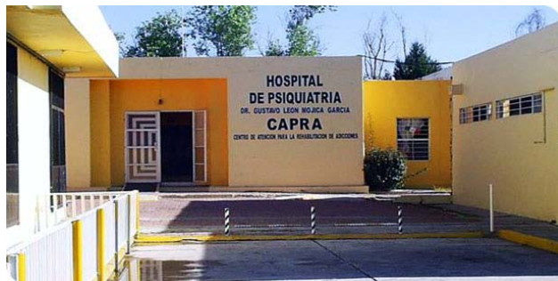
Medida para controlar plaga de mosca.

La Ley de la Comisión Estatal de Derechos Humanos faculta al organismo para emitir medidas cautelares frente a las amenazas, perturbaciones, restricciones o violaciones y para evitar la consumación de violaciones a derechos humanos. En ese sentido, este importante