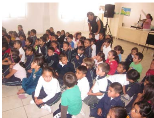
Niñas y niños por sus derechos.

Es por ello que la Comisión ha mantenido con especial interés la divulgación de información diversa relativa a los derechos de las personas mediante esquemas docentes bien estructurados.