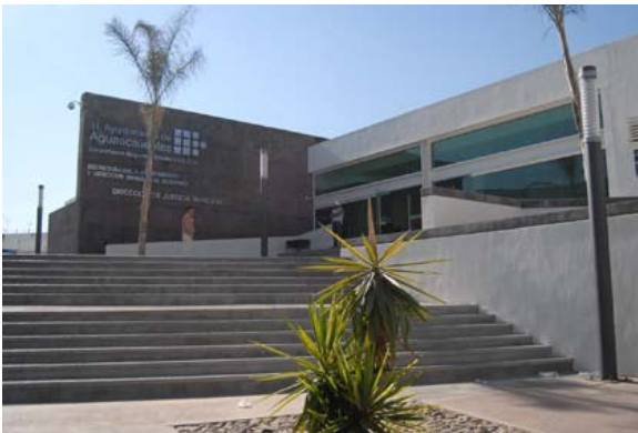
Seguridad pública municipal sigue siendo la principal entidad denunciada y con más recomendaciones.

La Comisión Estatal de Derechos Humanos, en el periodo de diciembre del 2011 a noviembre de 2012 emitió un total de 14 recomendaciones, 50 resoluciones de no competencia, una medida cautelar y dio respuesta a 33 solicitudes de información a través de la Ley de Transparencia.