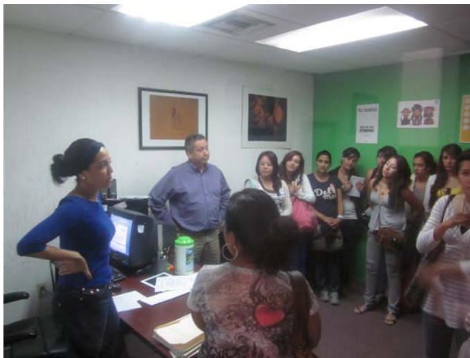
La Visitaduría atendió a 3 mil 385 personas.

La Visitaduría fue creada con el fin de recibir y tramitar peticiones de ciudadanos que han sido objeto de abusos del poder generando presuntas violaciones a los derechos humanos. Tiene bajo su responsabilidad, coordinar la elaboración de los dictámenes de conciliación o mediación, los proyectos de recomendación y otros acuerdos que se requieran, según la naturaleza de cada caso.