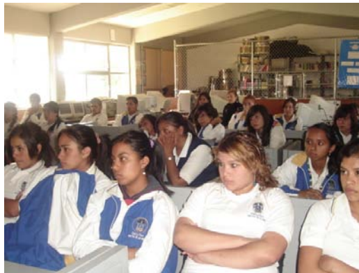
Se atendieron a 61 mil 231 personas en escuelas

Los retos que demanda nuestra sociedad en términos de respeto a los derechos humanos son muchos y algunos de ellos muy difíciles de alcanzar. La actual administración desde su inicio, le apostó al fortalecimiento de esquemas culturales y educativos como una fórmula para lograr un cambio de actitud de la gente respecto de los derechos fundamentales.